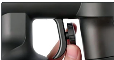
3 Отрегулируйте скорость подачи лосьона