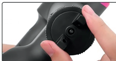
4 Отрегулируйте форму распыления (горизонтальное или вертикальное)