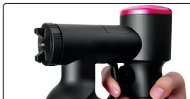
6 Нажмите курок для распыления лосьона

Первый запуск аппарата для моментального загара ProfiTan рекомендуется проводить с водой, настроив желаемую скорость подачи при помощи колёсика, расположенного на курке аппарата. Раскручивайте колесико по часовой стрелке для увеличения скорости подачи лосьона или влево для уменьшения скорости подачи лосьона. При стандартном нанесении лосьона на кожу сверху вниз, расположите форсунку (регулируемое сопло) вертикально. При нанесении лосьона слева направо или справа налево, расположите форсунку (регулируемое сопло) горизонтально. Рекомендуется наливать лосьон в колбу не более 1/3, чтобы избежать проливания лосьона. Во время нанесения лосьона на кожу, держите аппарат максимально прямо, не наклоняя его из стороны в сторону. Расстояние от зоны распыления 20-25 см, при нанесении на сухие и тонкие участки кожи (лицо, кисти, запястья) держите аппарат на большем расстоянии 30-35 см.