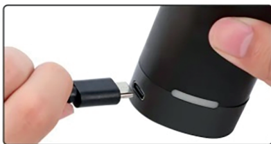
1 Зарядите аккумулятор