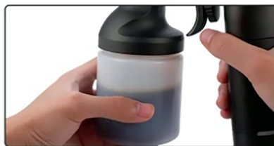
2 Налейте лосьон для автозагара